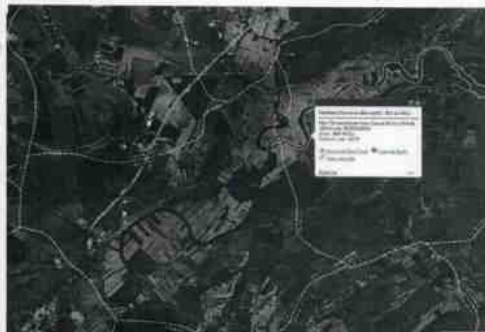
Fig. 2.13.1. Amplasarea fabricii de nutrețuri combinate față de arii naturale protejate:

Obiectivul este situat la distanța de cca 5,5 km sud-vest față de situl Natura 2000 ROSCI0382 - Râul Târnava Mare între Copșa Mică și Mihalț.